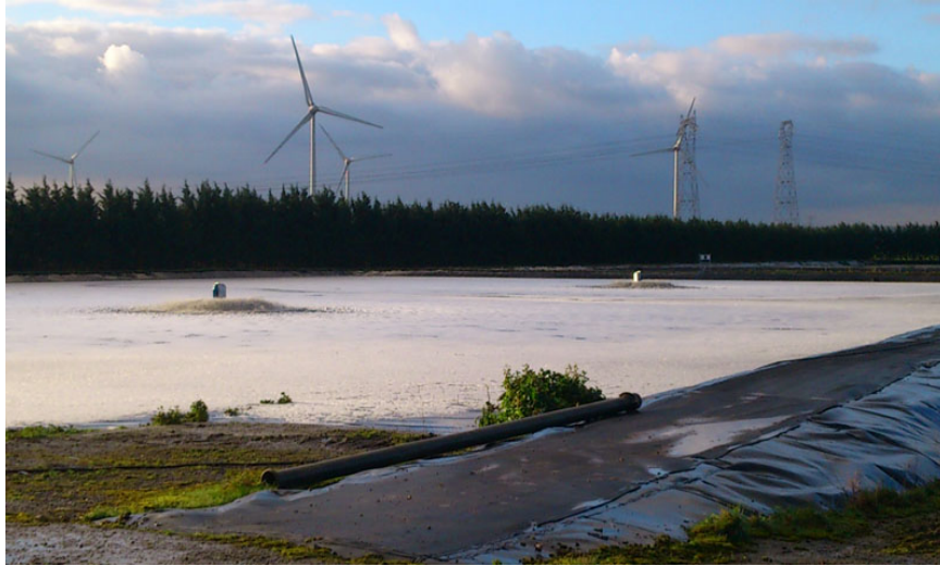
Aération de bassin de stockage en industrie sucrière (4 FLOPULSES 22kW)

En limitant le processus de fermentation , on peut limiter la production des composés olfactifs et ainsi limiter l'odeur désagréable d'un centre de traitement.